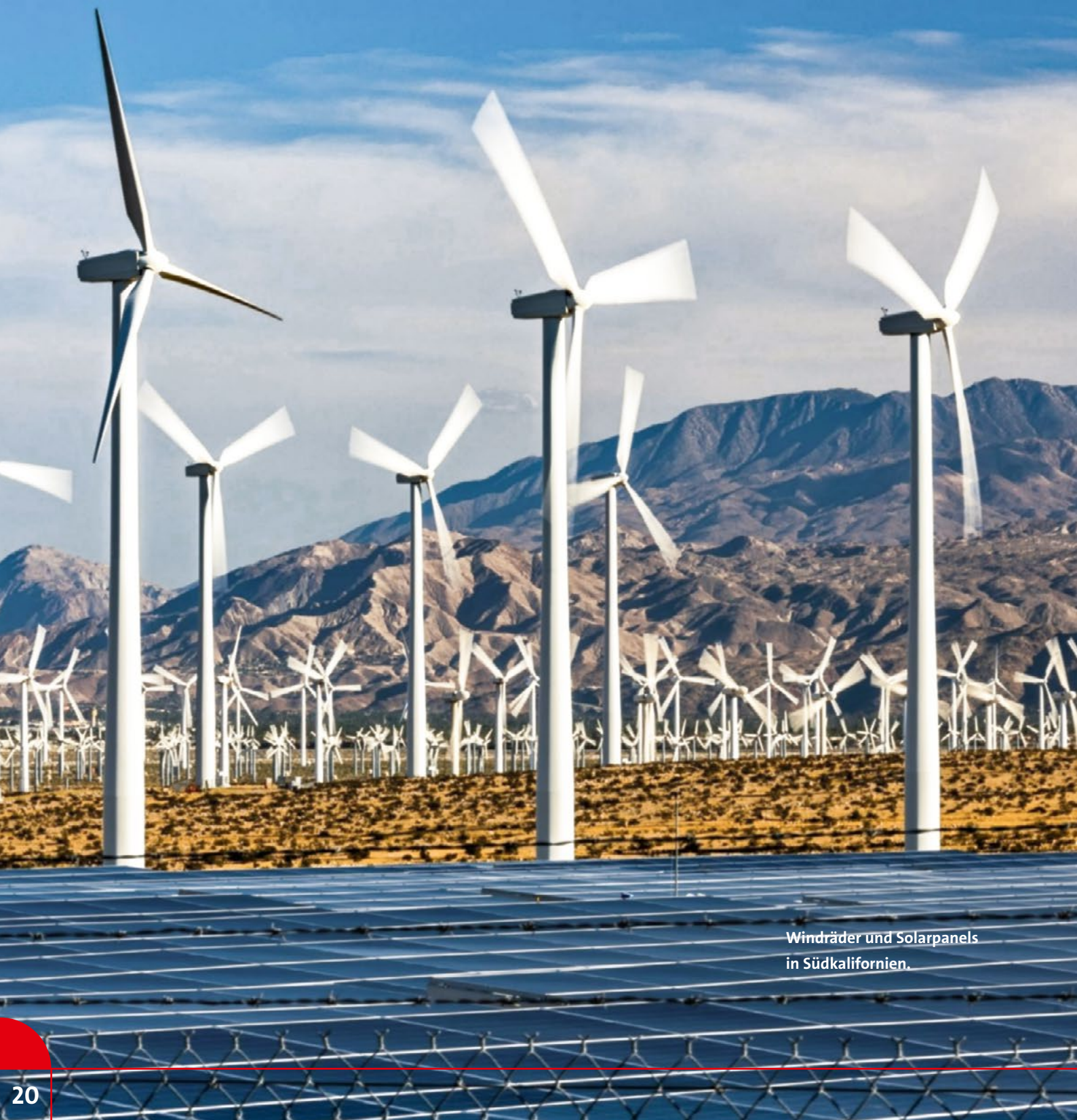
Windräder und Solarpanels in Südkalifornien.

Der US-Finanzdienstleister Hannon Armstrong ist eines der wenigen börsennotierten Unternehmen der USA, die ausschließlich in innovative Klimalösungen investieren. Seit Neuem profitieren auch Green Effects-Anleger von seinem konsequenten Geschäftsmodell.